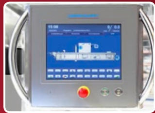
Modo de operación en más de 25 opciones idiomas

Diseño de líneas suaves que caracteriza la siguiente generación de máquinas de empaque